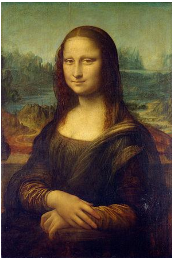
Мона Лиза (1503—1505 /1506)

Користио је нови композицијски приступ — централна фигура се налази напред и све је подређено њој, док су остале фигуре и предмети у позадини, груписани тако да још више истичу централну фигуру. Његове стилске иновације су још уочљивије у Тајној вечери , где је једну устаљену тему приказао на сасвим другачији начин. Уместо да 12 апостола представи као индивидуалне фигуре, он их групише у групе које окружују Христа као централну фигуру. Сасвим позади, кроз прозор је приказан пејзаж. Да Винчи апостоле и Христа приказује у моменту кад Христ објављује Јудину издају и на готово реалистички начин приказује различите емоције апостола, запрепашћених овом вешћу.